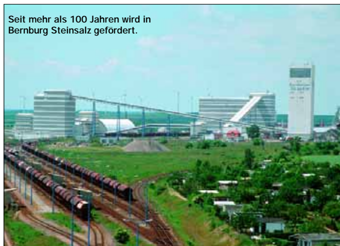
Seit mehr als 100 Jahren wird in Bernburg Steinsalz gefördert.

nikneubaus. Wiedereröffnung der Fürstengruft u. des Krummacherhauses als Gemeindezentrum. Entscheidung des Landtages: Bernburg (Saale) wird ab 01.07.2007 Kreisstadt des neuen „Salzlandkreises“ sein. 2006: Richtfest einer Produktionsanlage der Fa. ALMECO GmbH im Gewerbegebiet Bernburg (West). Eröffnung des Gepardengeheges im Tierpark. Umfangreiche Bau- und Sanierungsmaßnahmen am Bernburger Schloss. 2007: Eröffnung des Lidl-Logistikcenters.