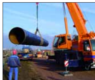
Investitionen in Netze und moderne Technologien gewährleisten eine hohe Versorgungssicherheit.