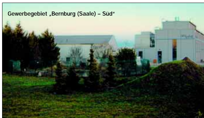
Gewerbegebiet „Bernburg (Saale) – Süd“