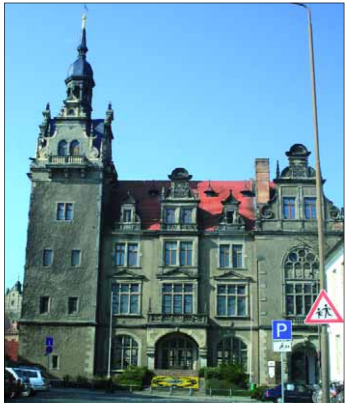
Sitz der Stadtverwaltung im Berburger Rathaus

In annähernd gleicher Entfernung zur Landeshauptstadt Magdeburg (ca. 44 km), zur größten Industriestadt Halle (Saale) (ca. 42km) und zum Oberzentrum Dessau (ca. 39 km) gelegen, bil-