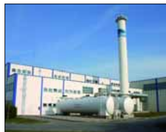
Im modernen Blockheizkraftwerk Friedenshall wird Strom nach dem umweltfreundlichen Prinzip der Kraft-Wärme-Kopplung erzeugt.