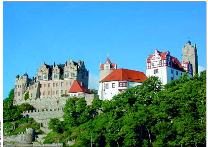
Blick auf das Schloss Bernburg

Als fürstlicher Bauherr ist sein Name eng mit der Erneuerung eines Teiles der alten Burg verbunden. In seinem Auftrag errichtete der Bau-