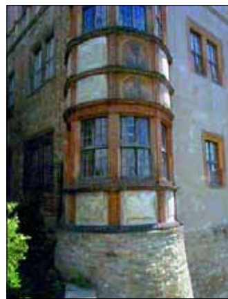
Eckerker am Renaissanceschloss

(Kloster der Marienknechte) Um 1300 ff., nahezu vollständig erhaltene Anlage mit bemerkenswerten Resten der langgestreckten ein-