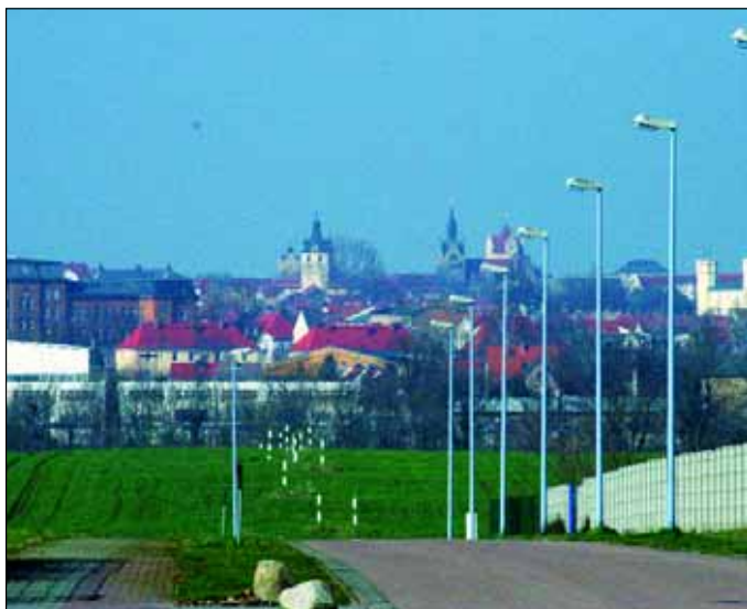
Blick vom Gewerbegebiet „Am Kirchfeld“ auf Bernburg.

Zwei weitere große und bedeutende Produktionsbetriebe sind: Die Serumwerk Bernburg AG (Herstellung von Arzneimitteln und Impfstoffen im Human- und Veterinärbereich) und die Ziegelwerke Baalberge GmbH & Co. KG.