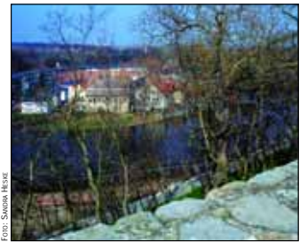
Bernburg bietet seinen Gästen zahlreiche Kultur- und Freizeitangebote

- Renaissanceschloss mit Museum - Romanische Dorfkirche St. Stephanie - Gotische und barocke Kirchen - Kloster der Marienknechte - Bummel durch die historische Altstadt - Theater und Kurhaus - Freizeit- und Erholungsgebiet „Krumholz“ direkt an der Saale mit Tiergarten, Parkeisenbahn, Märchengarten „Paradies“, Kegel-Freizeit-Center, Keblerturm - Fahrten mit dem MS „Saalefee“ durch das Saaletal - Radtouren entlang des Saaleradwanderweges - Jugendherberge, Hotels und landestypische Gastronomie. Geplante Projekte für die nächsten Jahre, wie zum Beispiel Ausbau der Uferpromenade und Bau von Gastliegeplätzen in Höhe der Fußgängerbrücke, tragen mit dazu bei, das Projekt „Blaues Band“ mit Leben zu erfüllen. Angebote für Wasserfreun-