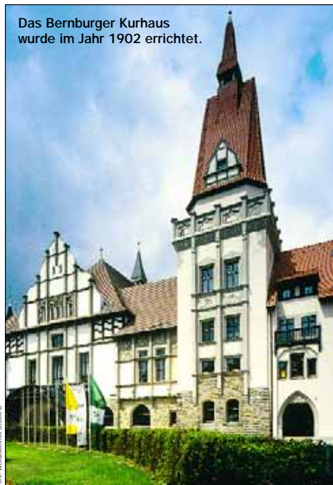
Das Bernburger Kurhaus wurde im Jahr 1902 errichtet.