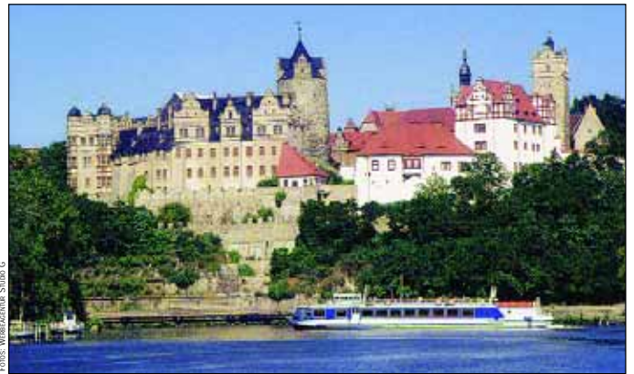
Blick zum Renaissanceschloss Bernburg

Der „Dicke Wilhelm“, erbaut 1896, gehört zu den Wahrzeichen der Stadt. Der Hochbehälter (Fassungs-